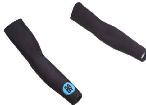
S6-0920U Manicotti Stampati