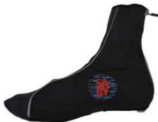
S6-0931U Copriscarpa invernali st.