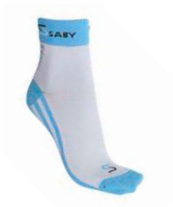
S6-0901U Calze estive basic