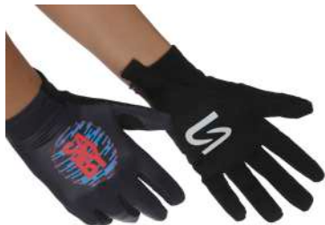
S6-0929U Guanti estivi con dita lunghe