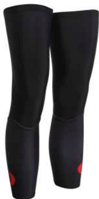
S6-0924U Gambali stampati